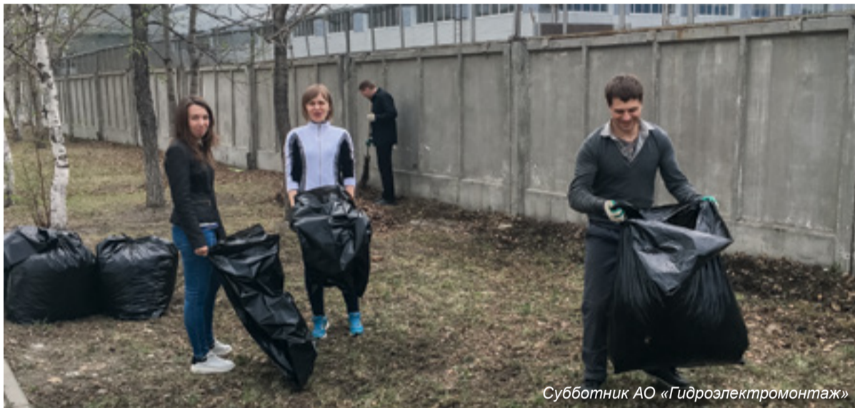
Субботник АО «Гидроэлектромонтаж»

«Коллектив нашего предприятия ежегодно выходит на субботник, мы стараемся поддерживать территорию в чистоте. Впереди День Победы — встретим его идеальным порядком и весенним