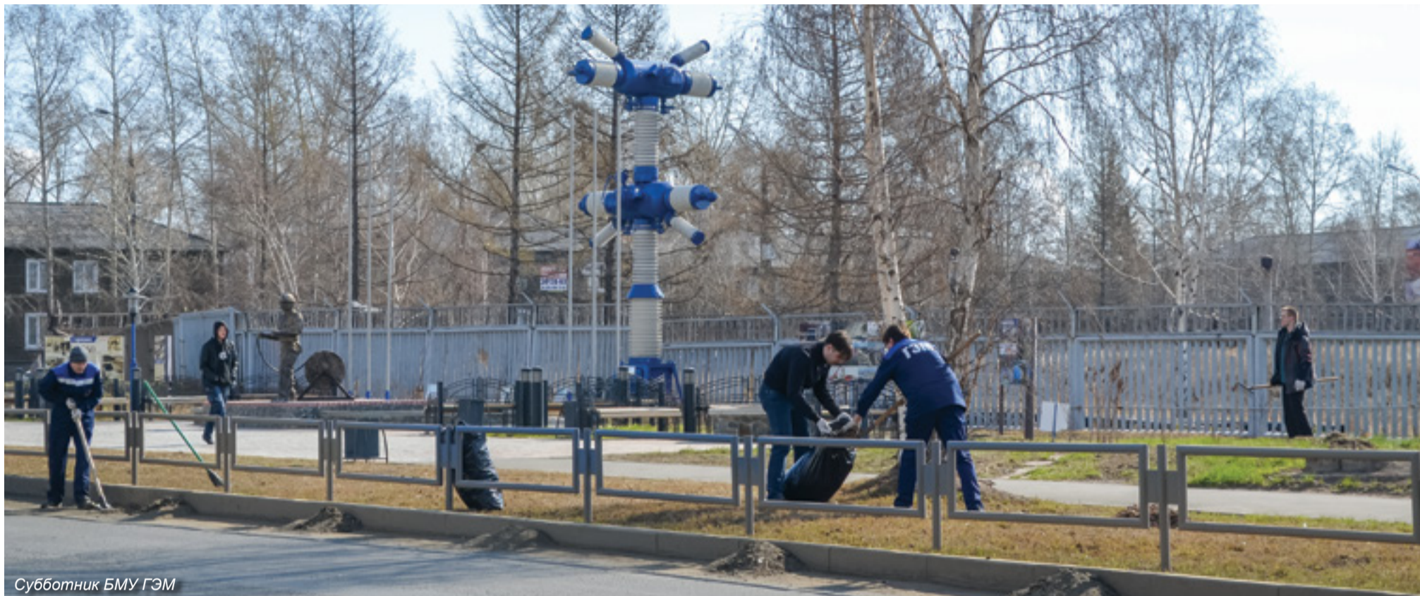
Субботник БМУ ГЭМ

ПРЕДПРИЯТИЯ ГРУППЫ КОМПАНИЙ «ГИДРОЭЛЕКТРОМОНТАЖ» ПРИНЯЛИ УЧАСТИЕ ВО ВСЕРОССИЙСКОМ СУББОТНИКЕ