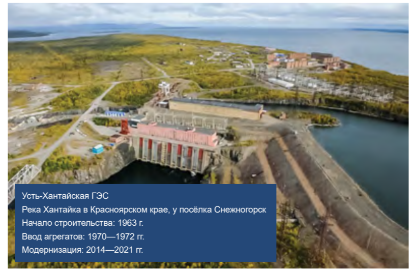
Усть-Хантайская ГЭС Река Хантайка в Красноярском крае, у посёлка Снежингорск Начало строительства: 1963 г. Ввод агрегатов: 1970—1972 гг. Модернизация: 2014—2021 гг.