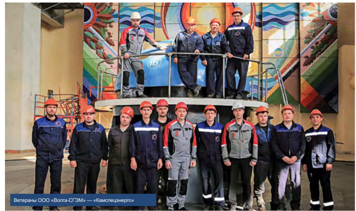
Ветераны ООО «Волга-СГЭМ» — «Камспецэнерго»

Коллектив Группы компаний «Гидроэлектромонтаж» от всей души поздравляет работников системы Всесоюзного треста Ордена Трудового Красного Знамени «Спецгидроэнергомонтаж» с знаменательной датой — 80 лет! Дорогие СГЭМовцы! Желаем Вам новых достижений и открытий в вашем востребованном труде для нашей Родины России! Здоровья, успехов и отличного настроения. Впереди новые стройки. Новые задачи, которые надо решать быстро и в срок.