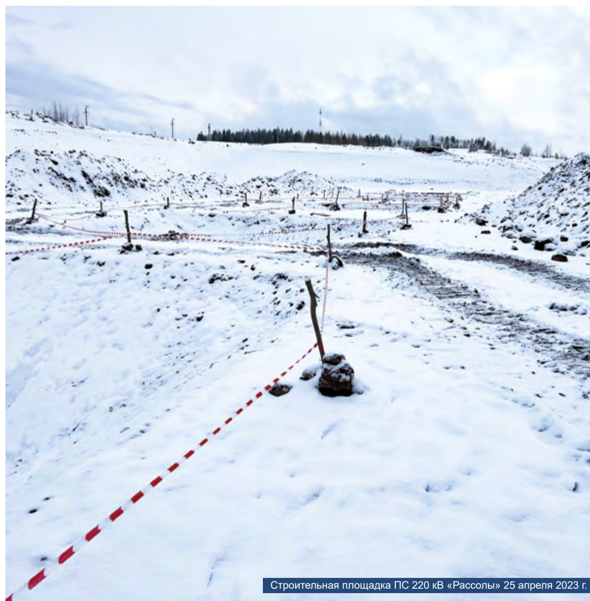
Строительная площадка ПС 220 кВ «Рассолы» 25 апреля 2023 г.

Оператор — Иркутская нефтяная компания (ИНК), для которой Ярактинское месторождение является основным — здесь добывается примерно 80 % углеводородного сырья компании. Держатель лицензии на разработку Ярактинского месторождения — ОАО «Усть-Кутнефтегаз» (дочернее предприятие ИНК).