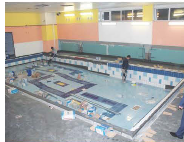
Ремонт чаши детского бассейна

Также БМУ ГЭМ выделяет средства для технического оснащения и ремонтов мест массового спорта и отдыха братчан. В этом году для ремонта чаши большого бассейна спорткомплекса «Таежный» и приобретения спортивного инвентаря в бассейн для самых маленьких выделено 80 тыс. руб. Более 50 тыс. рублей было выделено на приобретение лыж для лыжной базы «Спартак».