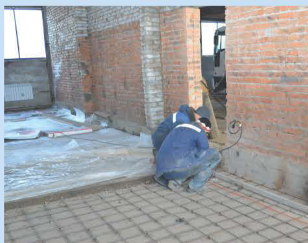
Ремонт базы Усть-Илимского филиала

7 Кадровые перестановки. Смена руководства Монтажно-заготовительного участка с целью изменения вектора развития МЗУ, отход от монтажа в сторону развития собственного производства на базе участка.