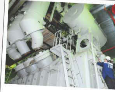
ТАЗ и БоАЗ

Группа компаний «Гидроэлектромонтаж» прорубило окно в Европу (Западную Сибирь) - завершен комплекс электромонтажных работ по реконструкции ПС Лузино.