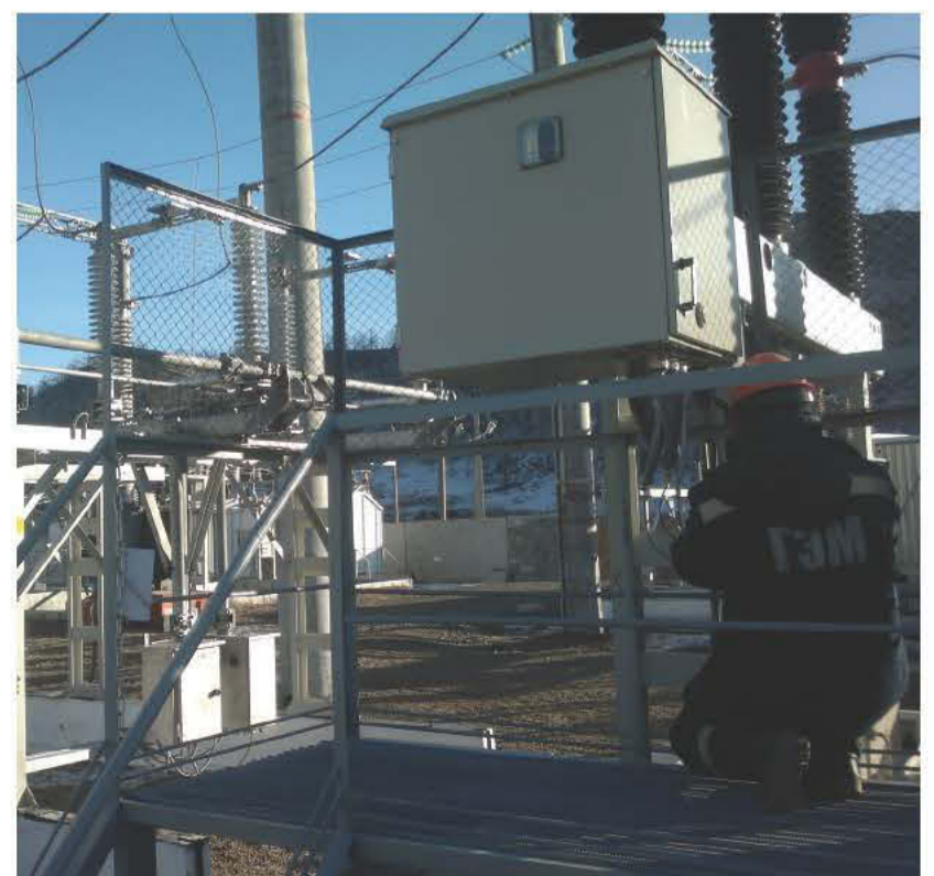
Реконструкция ПС 110/10 кВ Черноруд