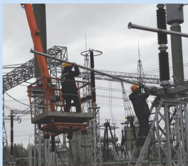
ПС 500 кВ Тайшет

Подводя первые итоги уходящего года, директор БМУ Гидроэлектромонтаж выбрал 10 наиболее важных событий для своего предприятия: