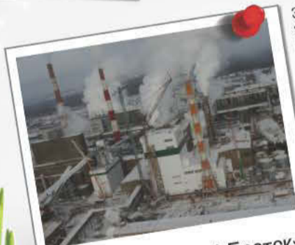
Проект «Большой Братск»

Продолан огромный объем работ на Тайшетском и Богучанском алюминиевых заводах.