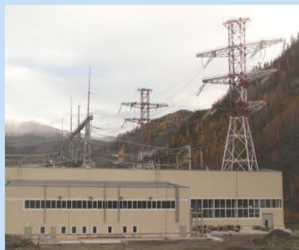
Здание КРУЭ 500 кВ СШГЭС

3 ПС 500 кВ «Амурская». Специалисты Благовещенского филиала ОАО «ГЭМ» выполнили весь комплекс электромонтажных работ на второй линии подстанции. В сентябре состоялся пуск линии, которая обеспечит транзит электроэнергии в КНР.