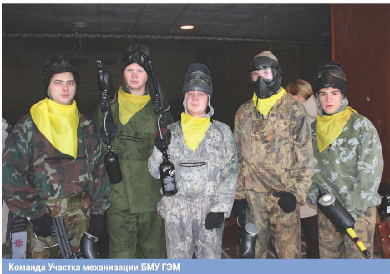
Команда Участка механизации БМУ ГЭМ

На базе стадиона Северный Артек в борьбе за главный трофей – Кубок Братской лиги пейнтбола, сошлись 9 команд. На импровизированном поле боя оборону держали команды ГЭС-ремонт, Росювелирторг, Братскэнергоремонт, БМУ ГЭМ, Востокнефтепровод, БСТ, ТЭЦ-6, сборная команда М-1 и сборная команда КГБ. Среди заявившихся