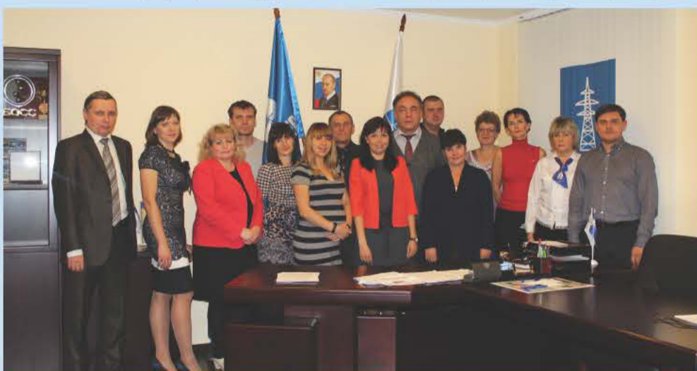
Команда управления ООО НПО «Промэнергосервис»

9 На предприятии произошла реструктуризация. Головным предприятием, с расширенным перечнем о допуске к определенным видам работ (свидетельств СПО) для заключения договоров с заказчиками, образовано ОАО «Промэнергосервис». Идет процесс регистрации выпуска ценных