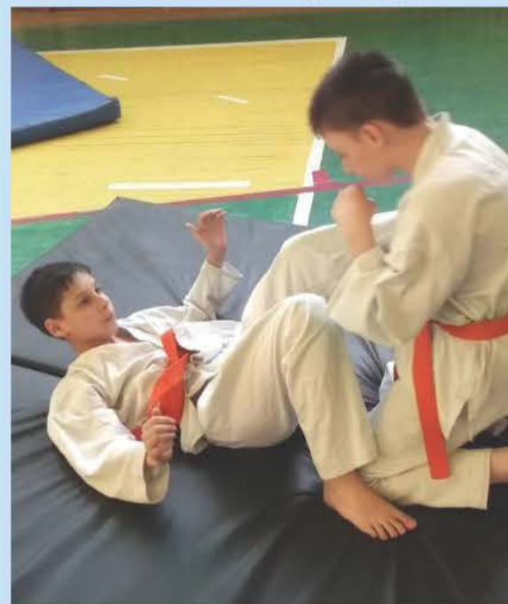
Воспитанники школы Будокай каратэ