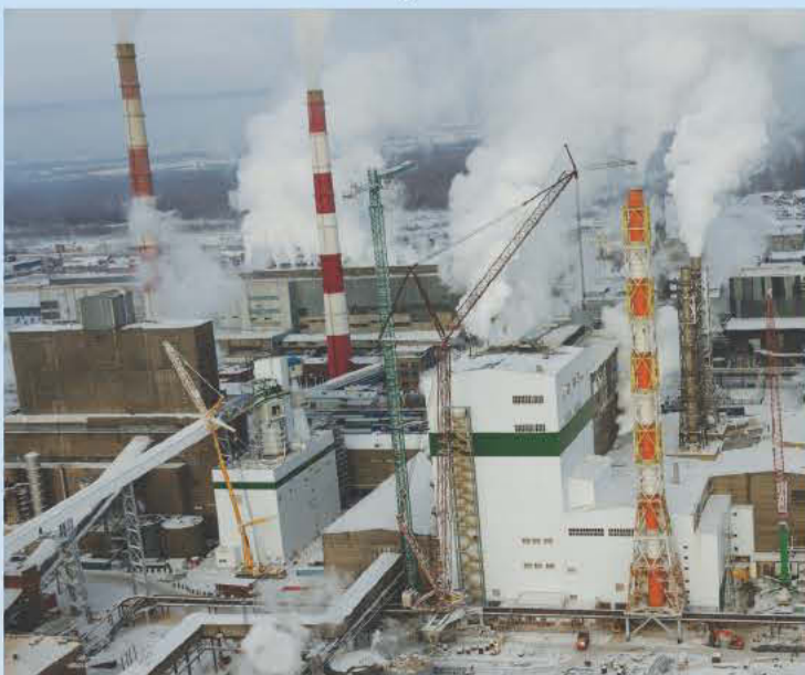
Проект «Большой Братск»

10 Признание. БМУ ГЭМ получил награду Пенсионного фонда РФ как лучший страхователь Иркутской области.