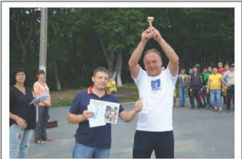
Спартакиада ОАО «ГЭМ»

Специалисты ООО «КЭМ» самостоятельно ведут серьезный объект - КРУЭ 500 кВ Воткинской ГЭС