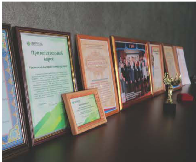
Благодарности от реципиентов

зывает всестороннюю помощь Дому ребенка, расположенному в селе Поярково Амурской области. В этом году энергетики перечислили учреждению более 100 000 рублей. А чтобы участие предприятия в жизни Дома ребенка было более эффективным и оперативным, с этого года в попечительский совет детского дома