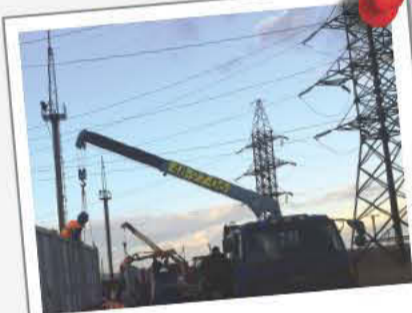
ПС 220/110/10 Лузино

В 2013 году мы приступили к работам на космодроме «Восточный» (п. Углегорск).