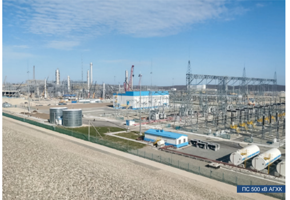
ПС 500 кВ АГХК

В следующем году продолжится строительство Благовещенского аэропортового комплекса. В течение 2024-2025 гг. будем прокладывать