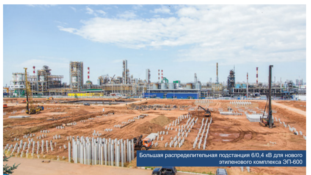
Большая распределительная подстанция 6/0,4 кВ для нового этиленового комплекса ЭП-600

На январь-февраль 2024 года запланирована установка российской газовой турбины большой мощности ГТЭ-110М производства ОДК-Сатурн на ТЭС Ударная. Станция расположена в Крымском районе Краснодарского края, строится для увеличения энергетической мощности, повышения системной надежности, а также поддержки стабильной работы энер-