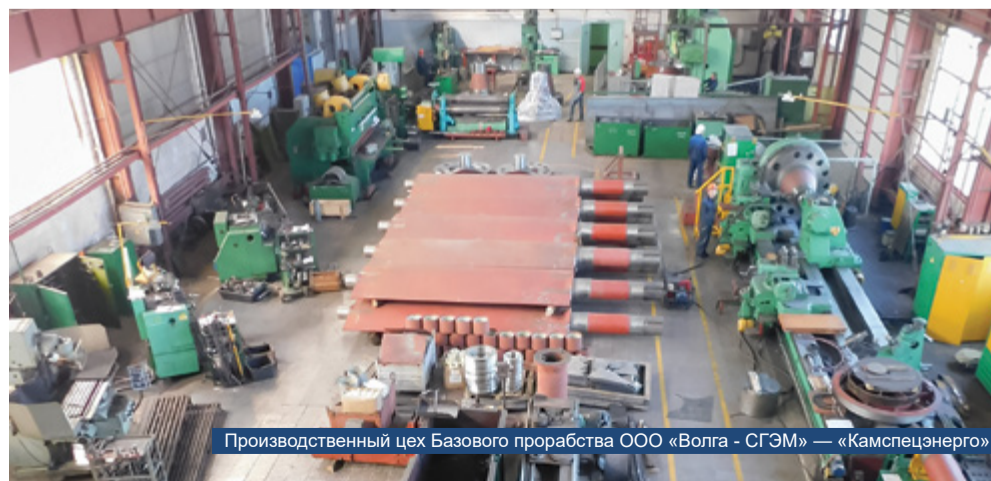
Производственный цех Базового прорабства ООО «Волга - СГЭМ» — «Камспецэнерго»

«В 2023 году наши специалисты были буквально нарасхват, думаю, что и в будущем году мы без работы не останемся»