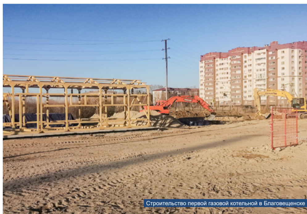
Строительство первой газовой котельной в Благовещенске