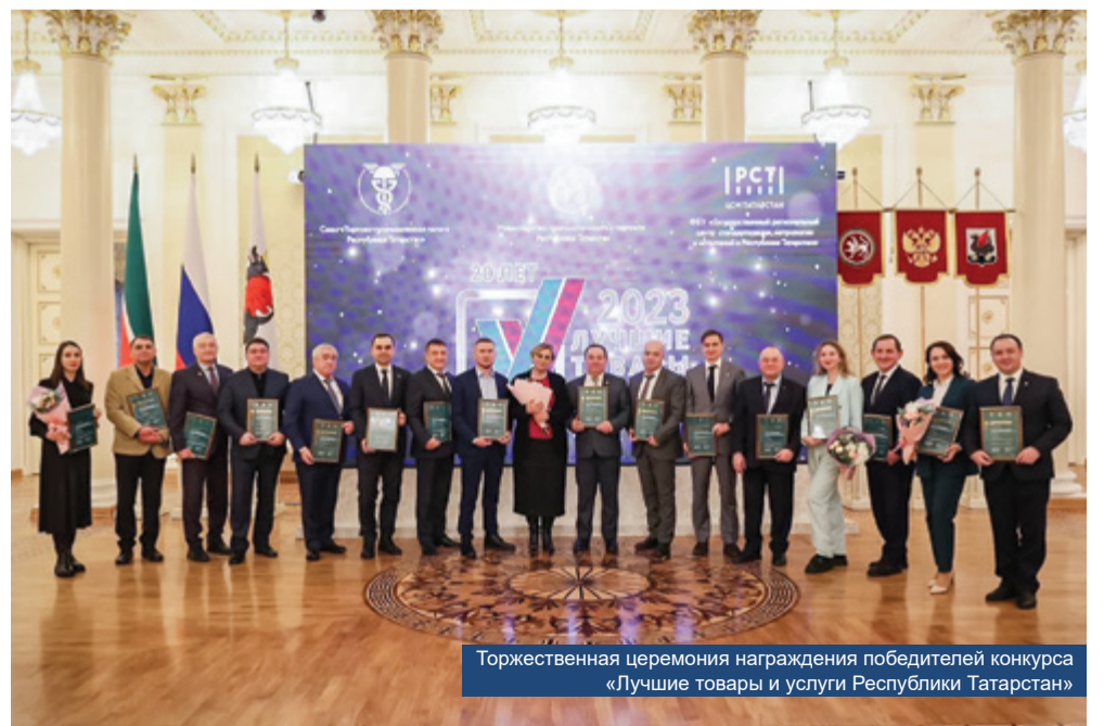
Торжественная церемония награждения победителей конкурса «Лучшие товары и услуги Республики Татарстан»

4. Всем коллегам отменного здоровья, надежных партнеров в бизнесе, достижения поставленных задач в профессиональной и личной жизни.