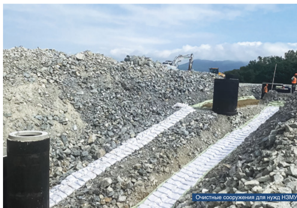
Очистные сооружения для нужд НЗМУ