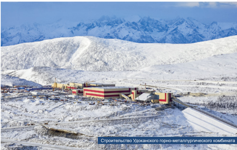
Строительство Удоканского горно-металлургического комбината

Работа на ОГОКе стала проверкой на прочность для многих руководителей, ответственных за данный объект. К сожалению, не все из них дошли до конца, не смогли справиться с решением сложных вопросов и задач, оставили объекты, не завершив их. Сегодня завершение этих объектов требует от нас значительных организационных и финансовых усилий. Мы очень рассчитываем на оперативную помощь наших коллег из ООО «КамаГЭМ», специалистов монтажно-заготовительного участка БМУ ГЭМ для того, чтобы завершить в кратчайшие сроки работы, которые еще остались.