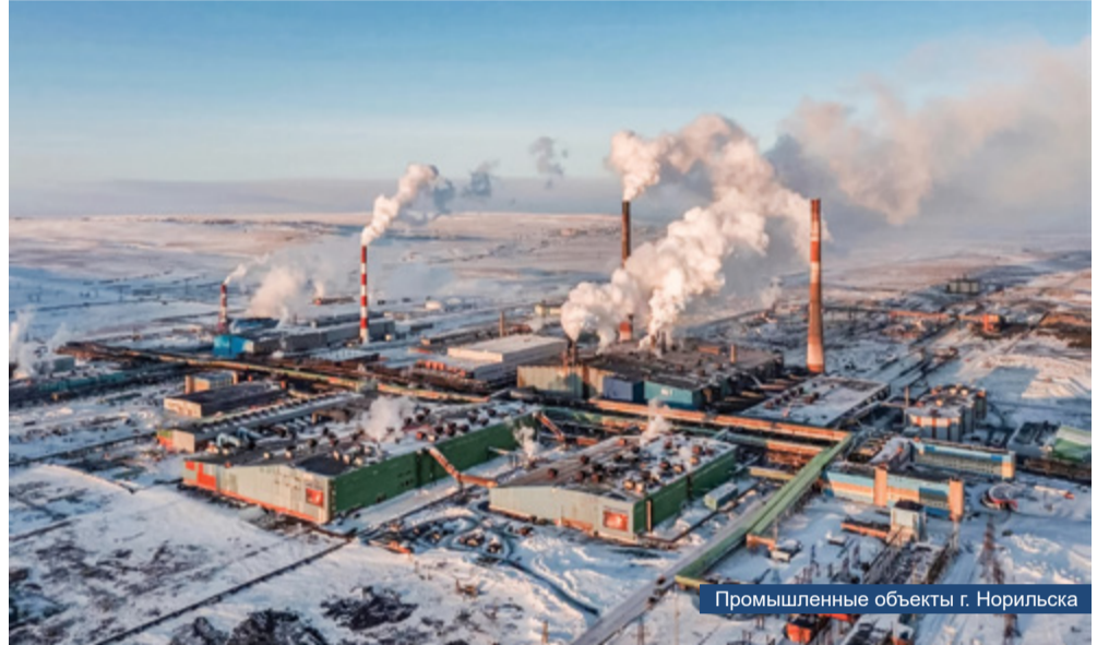
Промышленные объекты г. Норильска