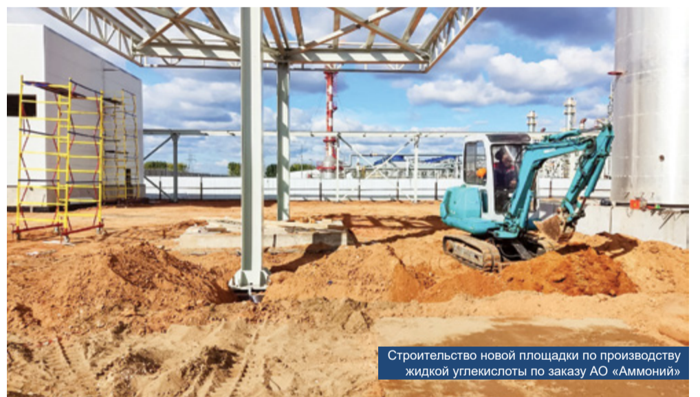
Строительство новой площадки по производству жидкой углекислоты по заказу АО «Аммоний»

госистемы юга России, Крымского полуострова и новых территорий.