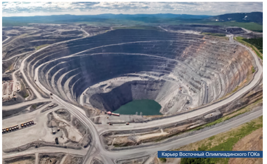
Карьер Восточный Олимпиадинского ГОКа