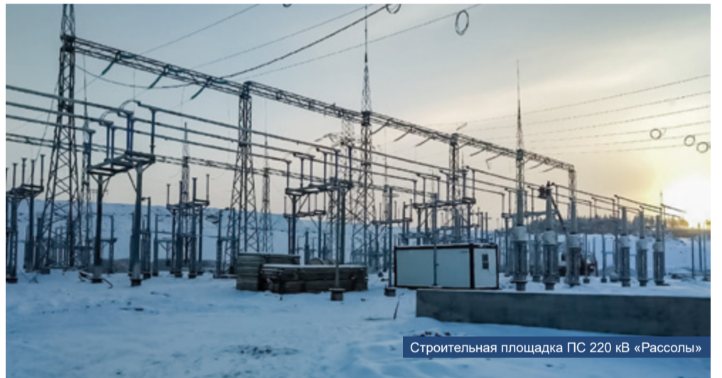
Строительная площадка ПС 220 кВ «Рассолы»

«Завершение строительства объектов Олимпиадинского ГОКа требует от нас значительных организационных и финансовых усилий. Мы очень рассчитываем на оперативную помощь наших коллег из ООО «КамаГЭМ», специалистов монтажно-заготовительного участка БМУ ГЭМ для того, чтобы завершить в кратчайшие сроки работы, которые еще остались»