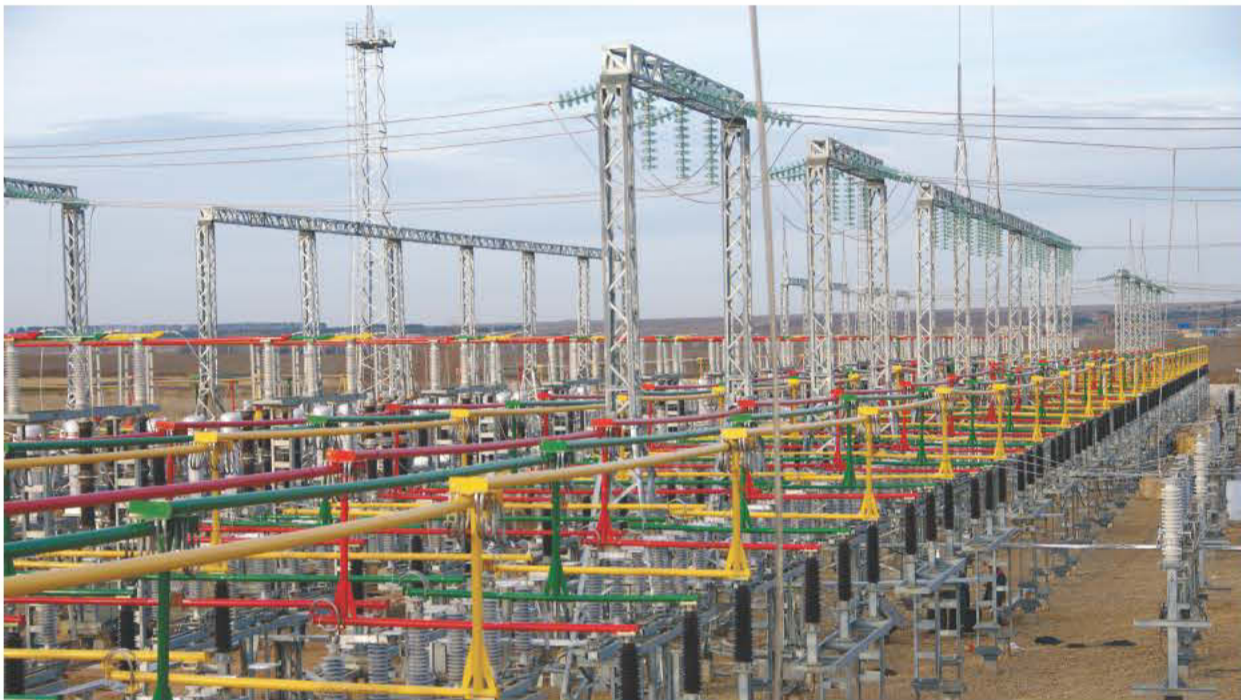
Заказчики удовлетворены проделанной работой

В особой экономической зоне «Алабуга» (Татарстан) запущена распределительная подстанция (РП-1,2). Этот энергообъект имеет стратегическое значение для региона. Сегодня он представляет собой связующее звено двух независимых вводов, а для резидентов зоны является гарантом бесперебойного электропитания по II категории надежности. Впрочем, смонтированное оборудование рассчитано на перспективу, и вскоре категория надежности повысится до I. Что же представляет из себя РП-1,2 и почему она так важна для региона – узнал наш корреспондент.