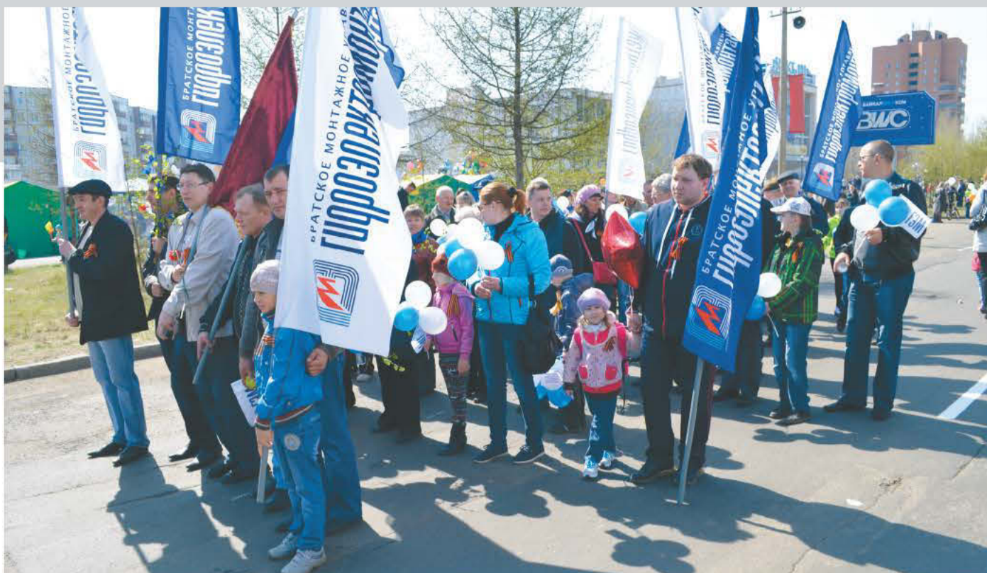
Праздничная колонна работников БМУ ГЭМ на торжественном параде 9 Мая