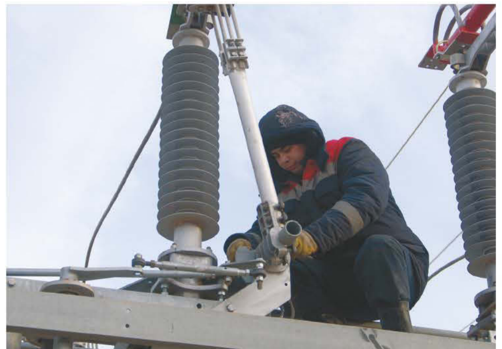
Казалось бы, и оборудование типовое, и коллектив опытный, но, как говорят сами монтажники, этот объект запомнится им надолго

Заказчик отметил, что работы выполнены не только качественно, но и оперативно, что, безусловно, важно для стабильной работы уже существующих предприятий-резидентов «Алабуги» и скорейшего запуска новых, а, стало быть, и роста экономической активности в регионе. Тем не менее, как мы уже оговорились выше, на РП-1,2 смонтировано оборудование с перспективой гаранти-