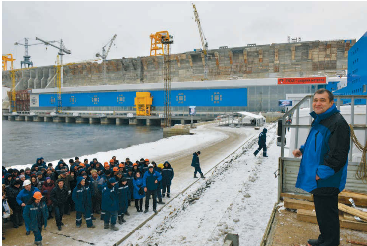
Памятное выступление перед коллективом с кузова автомобиля

А еще все наши респонденты, кого мы смогли опросить, готовя этот материал, не сговариваясь, отмечали, что получили богатый опыт на строительстве Богучанской ГЭС. Опыт, который уже сейчас им пригодился на других объектах. Об этом говорили и специалисты по прокладке кабеля, и монтажники трансформаторного оборудования. Однако, наверное, наибольший опыт на БогЭС приобрели инженеры-наладчики. Ведь на станции им приходилось решать архисложные задачи. Будучи самым последним гидросооружением в России такого масштаба, Богучанская ГЭС просто напичкана новейшими автоматическими системами контроля и управления работой оборудования, перечислить которое просто не реально в рамках одной газетной публикации. Все это потребовало от наладчиков не только приобретения современного оборудования, но и получения дополнительных