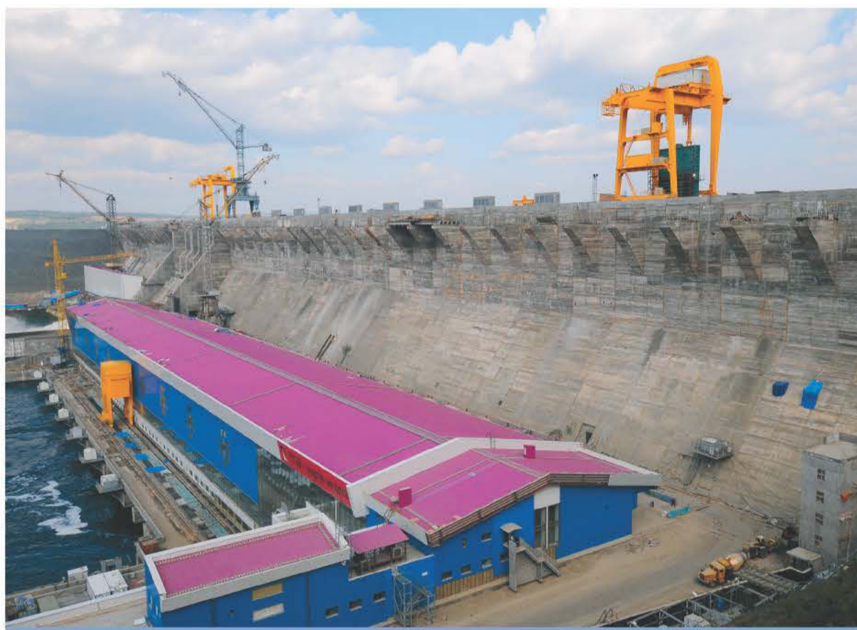
Вид Богучанской ГЭС

С учетом климатических условий Сибири по проекту блочные трансформаторы устанавливались в специальные ниши. Это сильно затрудняло задачу монтажа навесного оборудования трансформатора на месте, потому что никакие гру-