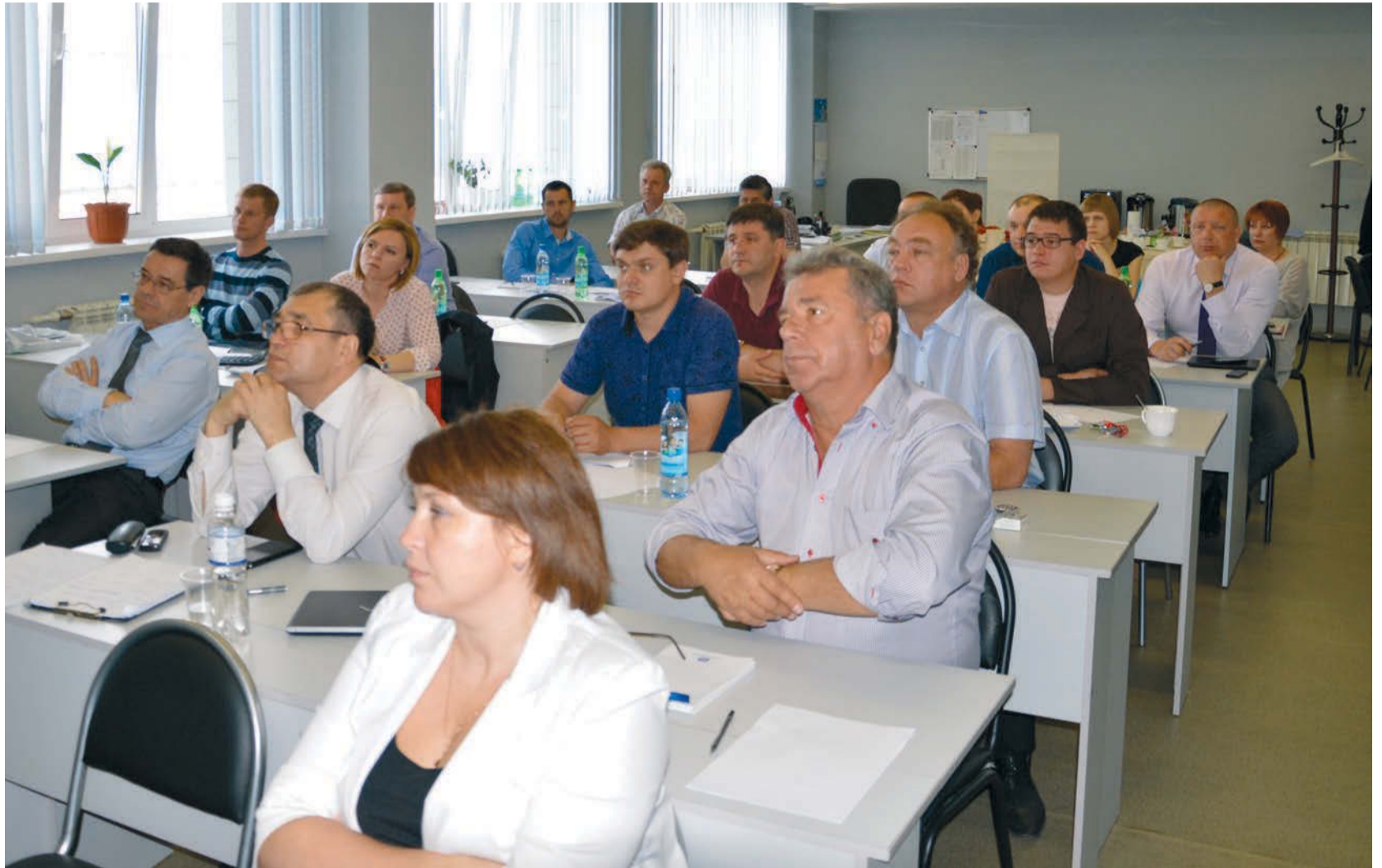
19-21 мая в г. Благовещенске прошло очередное совещание представителей и руководителей предприятий ГК «Гидроэлектромонтаж». На совещании обсуждались различные версии системы с целью определения оптимального варианта, и как результат, была окончательно утверждена общая для всех система оплаты