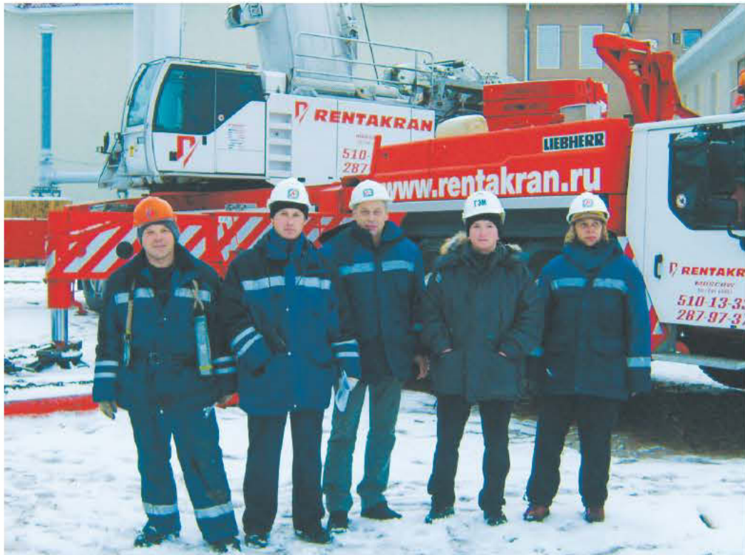
Памятное фото на фоне объекта