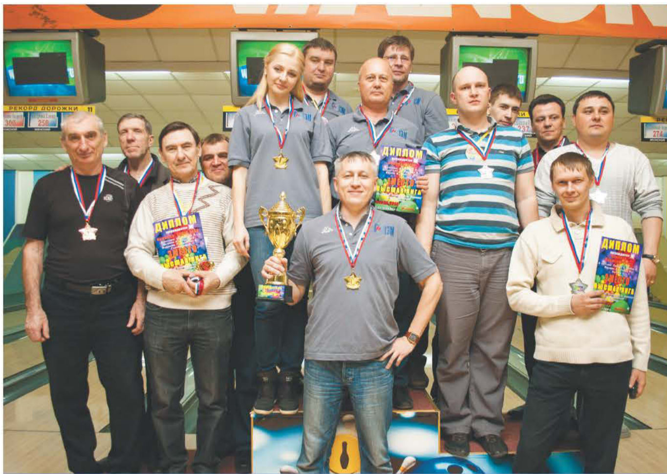
Команда «ГЭМ» на первом месте пьедестала

А мы поздравляем наших коллег с очередным успешным выступлением и надеемся, что в следующем сезоне Кубок победителя чемпионата среди организаций города Братска останется в ГЭМе!