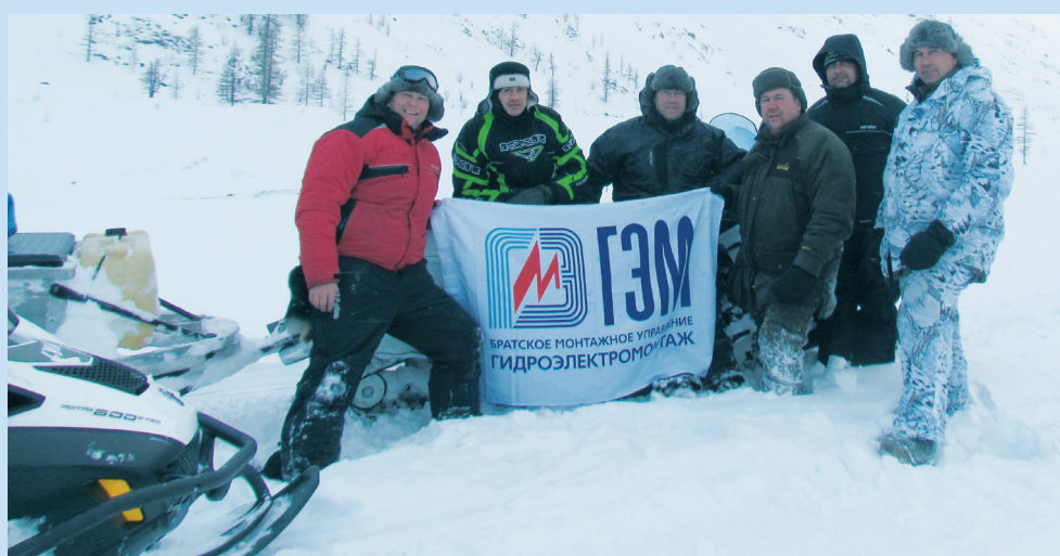
Перевал Большой Шибит, отметка 2300 м

В общей сложности участники экспедиции проехали на снегоходах около 1000 км по рекам Ия, Утхум, Большой и Малый Шибит, Додот. Самым тяжелым стал подъем в горы. Набитых троп не было, а толщина снежного покрова местами достигала 1,5 метра. Пришлось буквально пробивать снегоходами каждый километр пути. В горах приходилось дви-