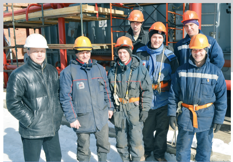
Бригада монтажников на Усть-Илимской ГЭС