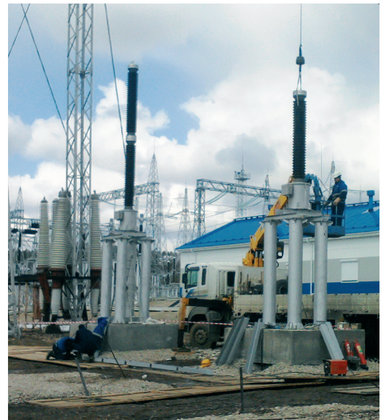
Работы на ПС «Амурская»