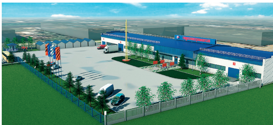
Так будет выглядеть Усть-Илимская база после ремонта

С наступлением весны стартовали основные работы по реконструкции промбазы Усть-Илимского филиала. Впрочем, назвать это реконструкцией можно только формально. От старой базы здесь останутся лишь стены, все остальное будет либо заменено, либо отстроено впервые. Ремонт в Усть-Илимске – это, наверное, самый масштабный инвестиционный проект БМУ ГЭМ. Общая стоимость работ и материалов составит более 20 миллионов рублей. Наш корреспондент отправился в северный город, чтобы воочию оценить масштабы и амбициозность проекта.